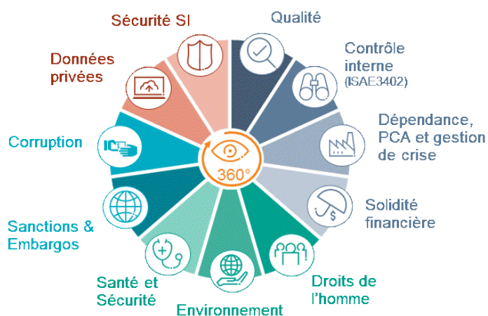
Fig. 1 : Exemple « d'univers de risques » liés aux tiers

Le temps est ainsi venu de coordonner et d'harmoniser ces démarches pour les rendre plus efficaces et pérennes. L'ensemble de ces démarches s'appuie opérationnellement sur des fondamentaux méthodologiques identiques.